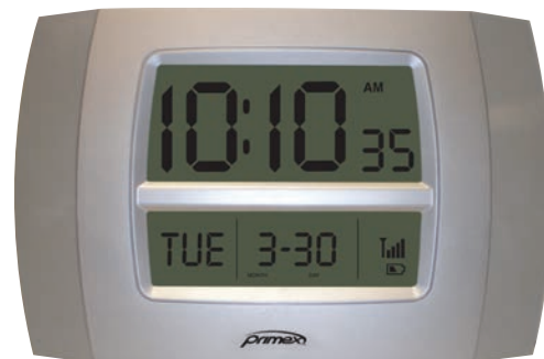
Horloge LCD de la gamme Personal

L'horloge LCD de la gamme Personal offre à la fois la précision de l'heure synchronisée ainsi que la commodité et le style contemporain recherchés pour l'espace privé. Avec la possibilité de la fixer solidement au mur ou de la poser sur un bureau, l'horloge de la gamme Personal offre une grande souplesse de déploiement.