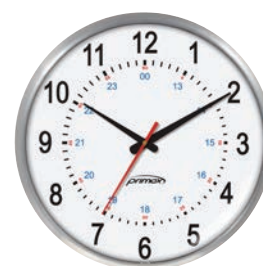
Métal mince Soins de santé