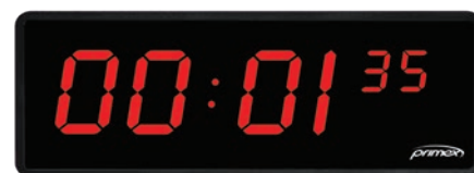
Trousse de chronomètre de code bleu

* L'horloge numérique doit être achetée séparément, elle peut être adaptée aux horloges LEVO existantes