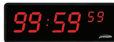
Trousse de chronomètre pour montage en surface

* L'horloge numérique doit être achetée séparément, elle peut être adaptée aux horloges LEVO existantes